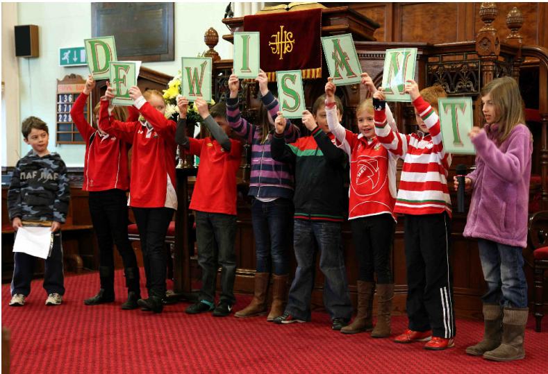
Gwasanaeth Gŵyl Ddewi y plant