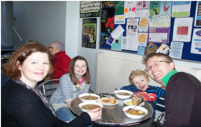
Cawl yn y Morlan (26 Chwefror 2011)