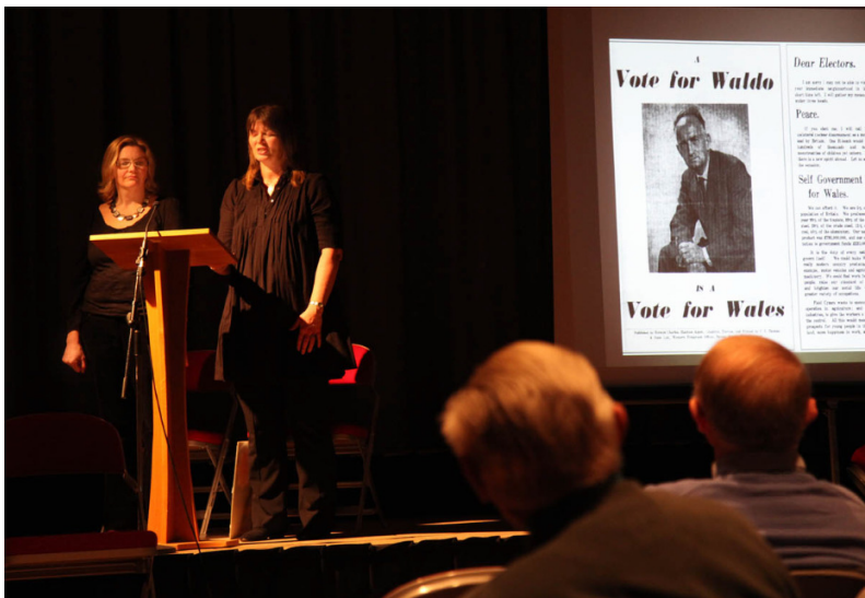
Perfformiad Cwmni Morlan o Byd yr Aderyn Bach , sef cyflwyniad am fywyd Waldo Williams (21 Mawrth 2011)

http://www.parliament.uk/biographies/ilora-finlay/26933